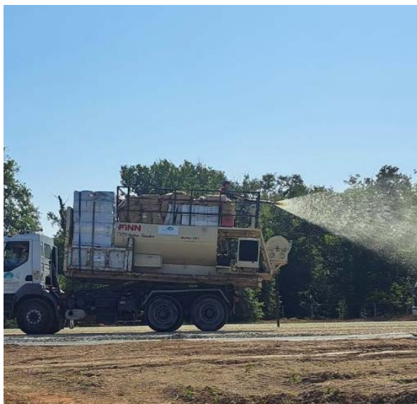
Ensemencement avec un "hydroseeder" qui pulvérise de façon homogène un mélange de semences sur les espaces.

La mise en œuvre des mesures compensatoires prévoit la création de prairies sur des terres agricoles initialement cultivées. Pour cela, l'équipe d'insertion paysagère ont réalisé au printemps la préparation des sols et les premiers ensemencements.