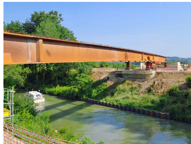
L'ensemble des 6 tronçons de charpentes métalliques a été lancé mi-juin pour le pont du canal latéral.