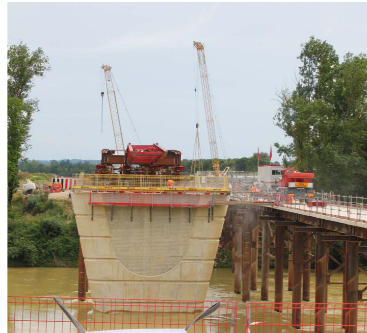
15 mètres de haut sur 15 mètres de large de béton : après une première pile coulée début mai, la seconde a été réalisée début juin. La coloration du béton, l'utilisation de baguettes et d'une matrice de coffrage aspect pierre offrent un rendu esthétique cohérent avec l'architecture agenaise.