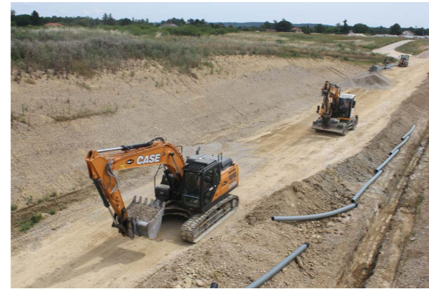
Sur la section courante, la réalisation de la couche de forme permettra d'accueillir en fin d'été la couche de roulement, structure supérieure de la chaussée.