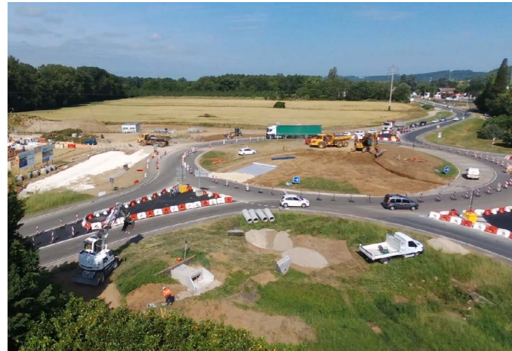
Le chantier a débuté en juin sur le rond-point de Camélat.